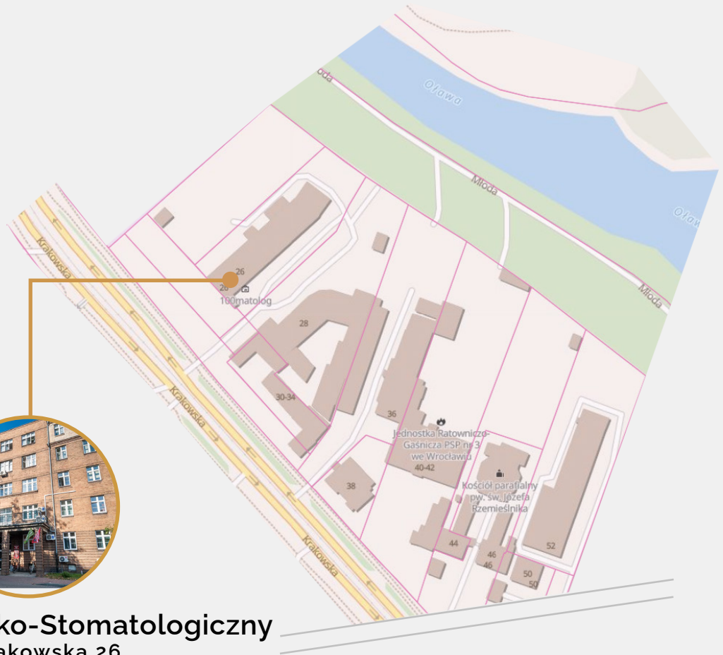
Wydział Lekarsko-Stomatologiczny ul. Krakowska 26